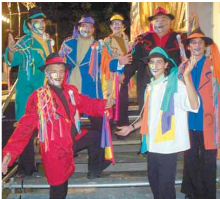
/ De Todas Partes

Es difícil y al mismo tiempo es lindo, porque hacés lo que te gusta y sólo porque te gusta. Somos ilustres desconocidos. Está un poco como guacha la categoría. Este carnaval que tan arriba se fue, que tan bien considerado está, yo siempre digo que está vestido de traje pero con alpargatas, y las alpargatas seríamos nosotros.