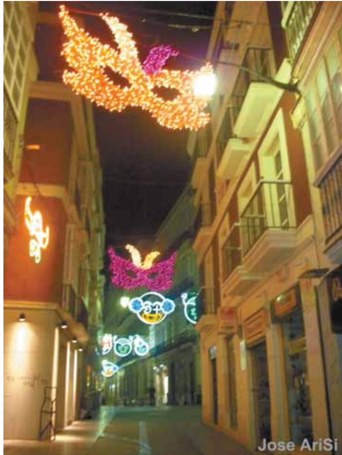
Cádiz, una semana antes del carnaval

Y hablando de cortes, para los viejos y los jóvenes, Cádiz es como una