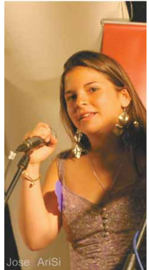
Princesa