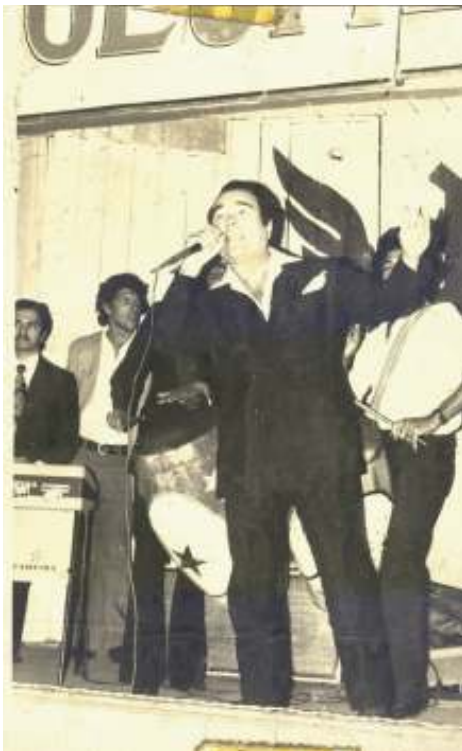
El querido Alberto Castillo cantando en un tablado, quien logró gracias a su amor por el carnaval que se conociera nuestra música por todo el mundo.