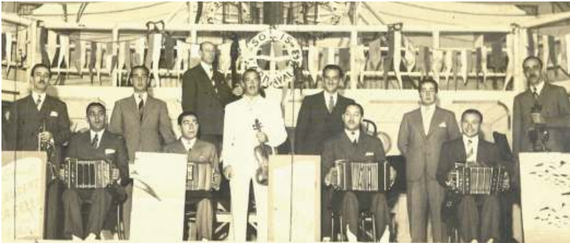
Las grandes orquestas engalanaron los grandes bailes, en esta foto de la década del 40, vemos a una de ellas en un febrero por el Teatro Solís