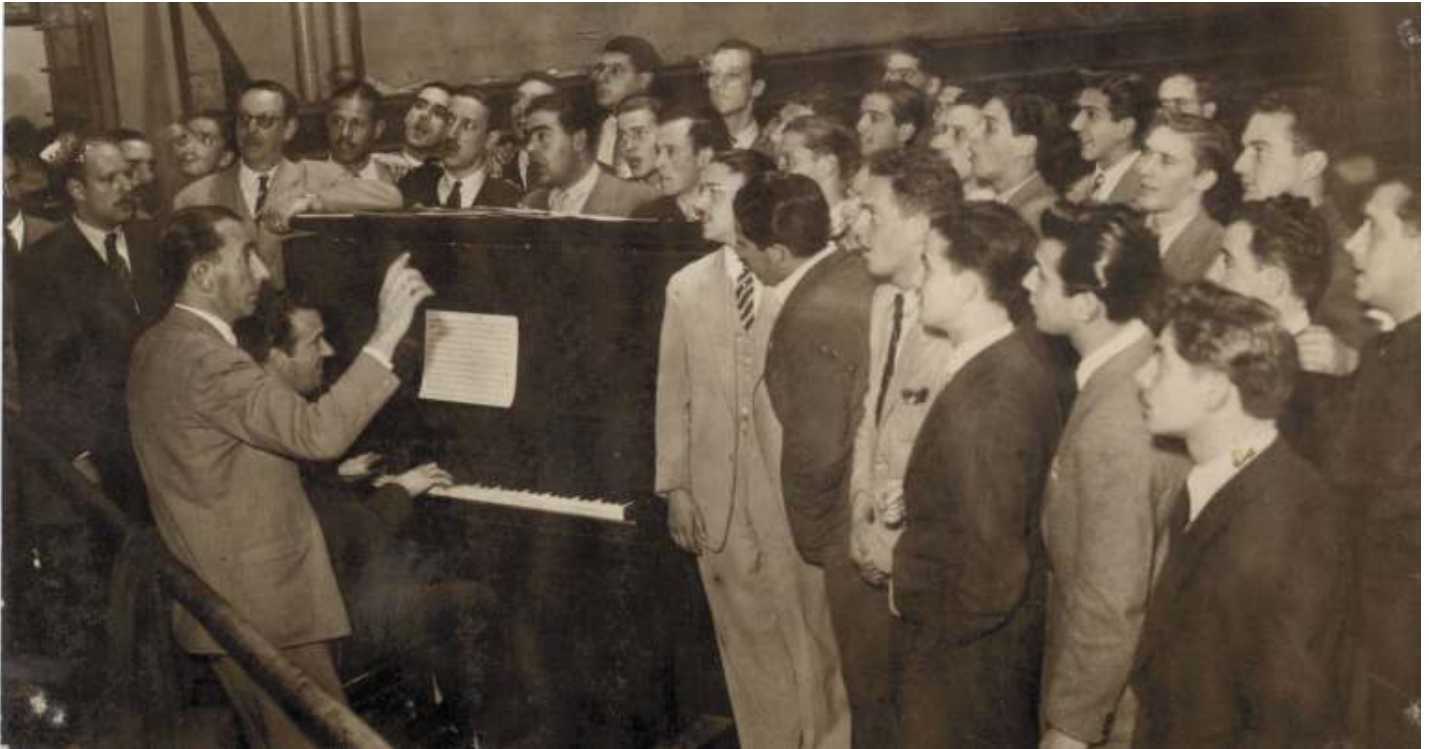
Ramón Collazo y su gente en un ensayo, quizás preparando una de sus más famosas creaciones junto con Víctor Soliño, el tango Adiós mi Barrio , el cual es hasta la fecha un símbolo de la música popular uruguaya