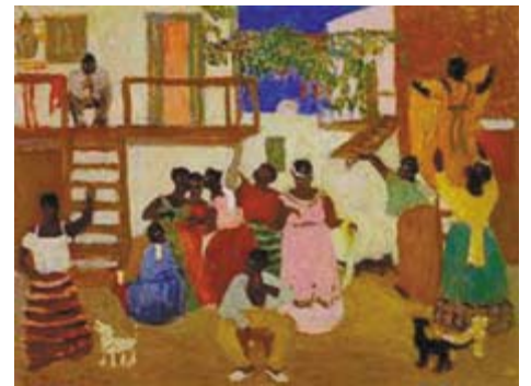
Candombes de Pedro Figari.

Como dice Eduardo Galeano, nuestros ancestros "pintaron realidad" porque era necesario para seguir viviendo que apostaran a un mundo posible en donde