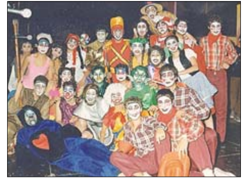
Parodistas Bubys Bis 2005.

8.- ¿Qué aporte le harías? Que hubiera más Carnaval y no sólo concurso.