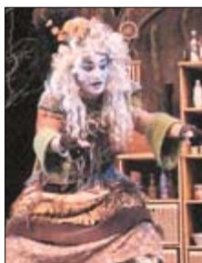
La bruja para niños.